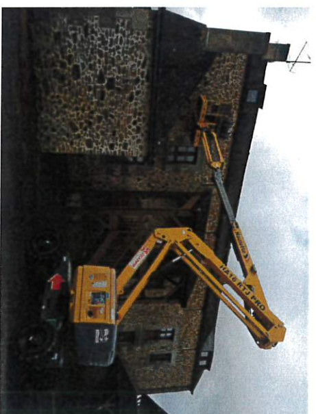
Installation des nids artificiels sur la ferme de Glaharon le 9 mars 2022