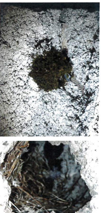
Nid de Troglodyte mignon au sous sol dans un parpaing et nid de Moineau domestique au 2ème étage également dans un parpaing

De plus, un ancien nid d'Hirondelle rustique a été trouvé dans la cheminée détruite au dernière étage, cette espèce n'avait pas été notée lors de l'état des lieux de 2020.